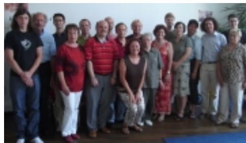
Der neue SPD-Bezirksvorstand