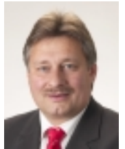
Martin Burkert, MdB

gleiter verzichtet werden. Insbesondere mit Hinweis auf die aktuelle Sicherheitsdiskussion warnen die SPD-Verkehrspolitiker nachdrücklich davor, dass immer mehr regionale Züge ohne Kundenbetreuer unterwegs sind. Auf besonders scharfe Kritik stößt es, wenn jetzt auch Doppelstockzüge ohne jeden Zugbegleiter verkehren sollen.