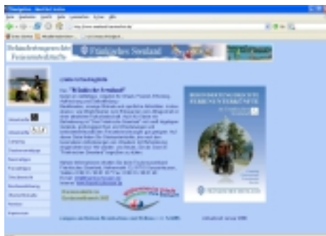
Das fränkische Seenland wirbt auf seiner Homepage bereits mit Barrierefreiheit

„Barrierefreiheit ist ein zukunfts-fähiges Qualitätsmerkmal sowie ein wichtiger Wettbewerbsvorteil im Konzert der Metropolregionen. Die Metropolregion Nürnberg hat die Chance, die behindertenfreund-