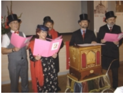
Beim Festakt wurde eine Moritat auf die Treuchtlinger SPD dargeboten

Das „Geburtstagsständchen“ zum Auftakt des Festabends bot einen Rückblick auf die Geschehnisse im Ortsverein, hier in Auszügen: